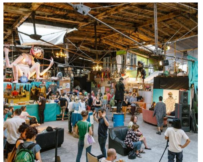
La SemencerIE réunit une foule d'artistes appliquant toutes sortes de techniques, 42, rue du Ban-de-la-Roche à Strasbourg.